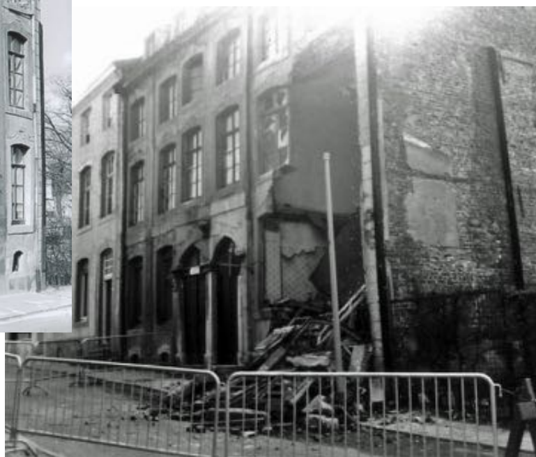
In 1970 stortte een deel van het bouwvallig pand in