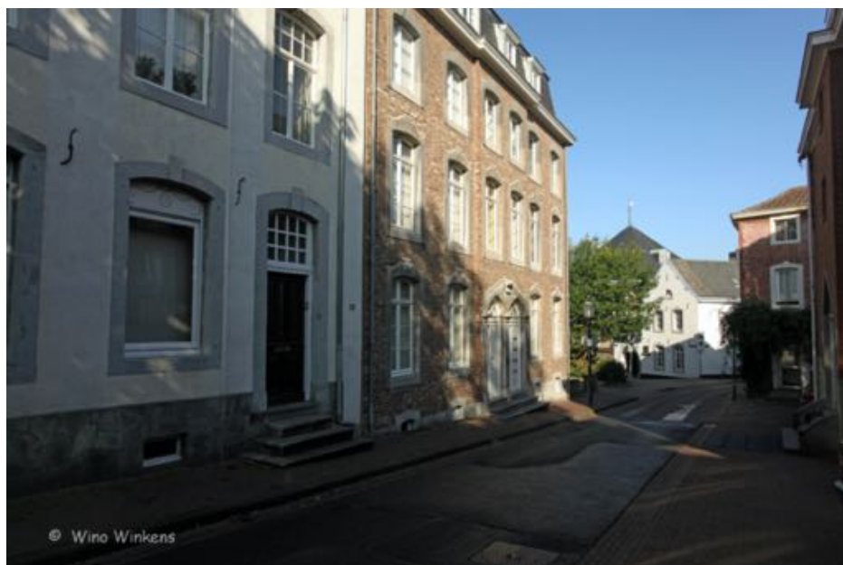
Het huidige pand