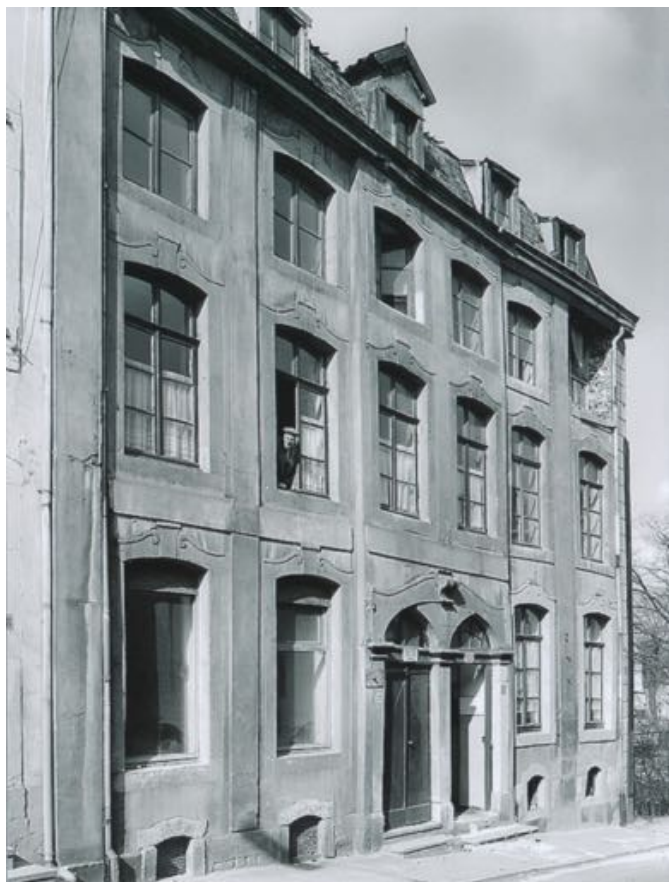
1967 – In het raam d'r Tsiep va Dautzenberg